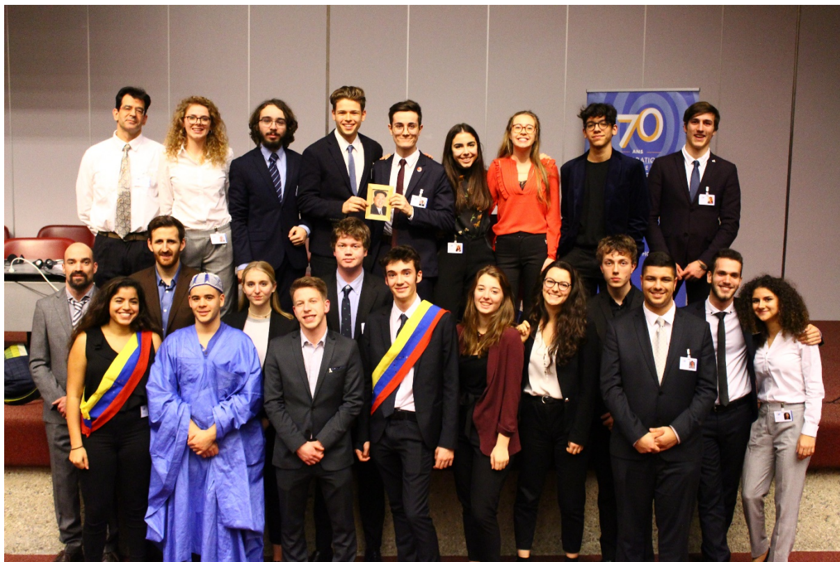
Groupe du cours facultatif SUN lors de l'AG de fin janvier 2018.